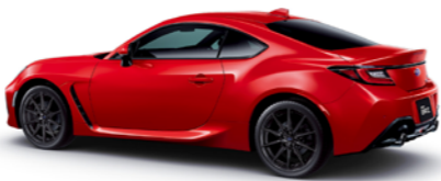
SUBARU BRZ / 〈ext〉イグニッションレッド 〈int〉ブラック