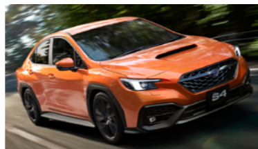
WRX S4 / 〈ext〉ソーラー オレンジ・パール 〈int〉ブラック