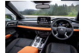
〈int〉ブラック&サドルタン