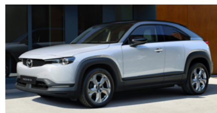
〈ext〉セラミックメタリック (3トーン)