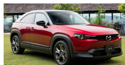
〈ext〉ソウルレッドクリスタルメタリック (3トーン)