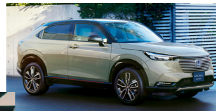
〈ext〉サンドカーキ・パール&ブラック 〈int〉グレージュ