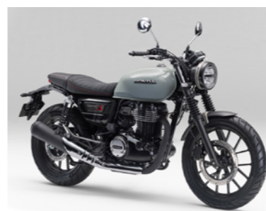
パールディーブマッドグレー