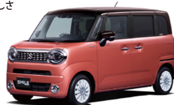
〈ext〉コーラルオレンジメタリック アーバンブラウン2トーンルーフ