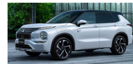
〈ext〉ホワイトダイヤモンド/ ブラックマイカ 〈int〉ライトグレー