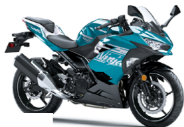
Ninja 400:パールナイトシェードティール× メタリックスパークブラック