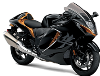
ガラススパークルブラック / キャンディパーントゴールド