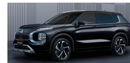
〈ext〉ブラックダイヤモンド/ディーブロンズ メタリック