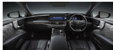
〈ext〉銀影ラスター 〈int〉プラチナ箔&西陣* (ブラック)