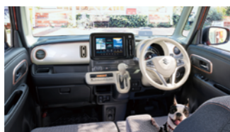
〈int〉銅パーゴールド ×アイボリーパール カラーパネル